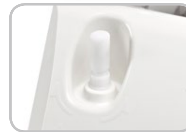
Electromechanical system which makes the machine reliable at any temperature