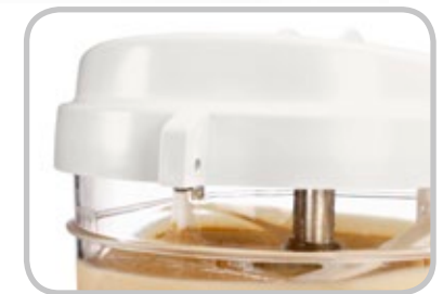
Lid block system